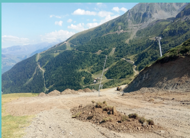
Entrée de Tortes

- Terrassement de la plateforme d'arrivée du télésiège d'Aulon pour la rendre plus vaste et faciliter le travail des dameuses et pose d'un géotextile sur le talus pour faciliter la reprise de la végétation.