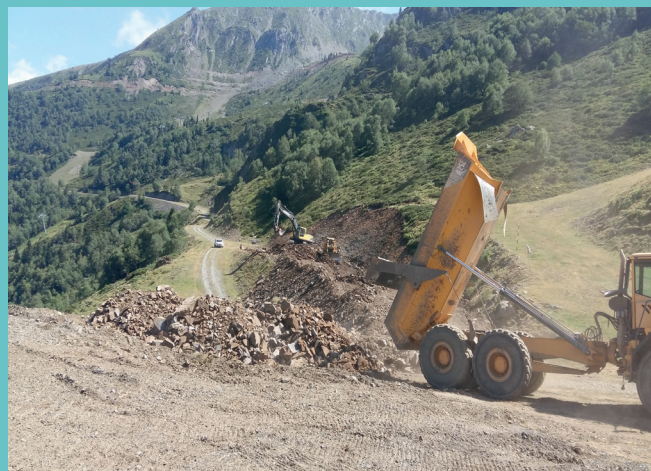
Arrivée de la Corniche

- Réaménagement de l'entrée du chemin de Tortes et de la continuité de la Mirabelle, élargissement du chemin (de 5m à 10m) avec une correction du profil de la piste entre le bas de Terrenere et le départ du télésiège fixe de Tortes. Ce chantier a nécessité 15.000 m 3 de terrassement dont 5.000 m 3 transportés.