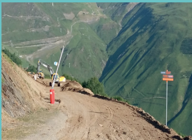
Traversée de la Corniche au Bassia

- Amélioration de la piste de la Corniche dans la traversée du Bassia par la création d'une zone de réflexion en amont, de l'élargissement de la piste de la Corniche (de 4,5m à 9m), d'une continuité de piste entre Bassia 2 (mur) et Bassia 3 (nouvelle combe) et d'une entrée pour la piste des Bouleaux. Ce chantier a nécessité 10.000 m 3 de terrassements.