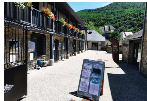
La Maison du Patrimoine à Saint-Lary Village

Cet été, en tenant compte du strict respect des mesures barrières et des recommandations contenues dans le référentiel sanitaire de l'Agence Régionale de Santé, la “Destination Saint-Lary” propose un large panel d'activités et d'animations sur ces différents sites.