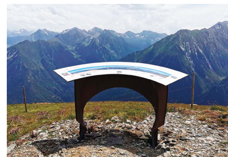
La table d'orientation au Pla d'Adet