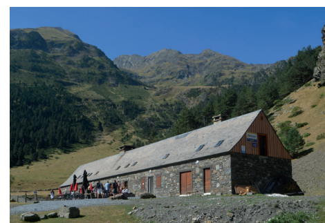
L'Hospice du Rioumajou

Détail de l'ensemble des animations et activités auprès de l'Office de Tourisme de Saint-Lary Soulan ou sur le site www.saintlary.com .